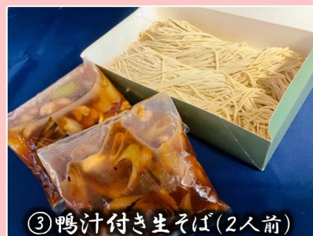
③鴨汁付き生そば(2人前)