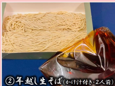
②年越し生そば(かけ汁付き・2人前)