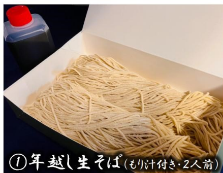
①年越し生そば(もり汁付き・2人前)