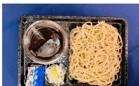
④年越もりそばパック(1人前)