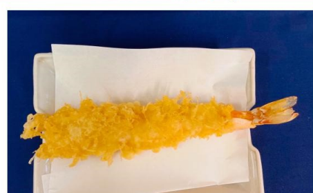
⑤天然えびの天ぷら(1本)